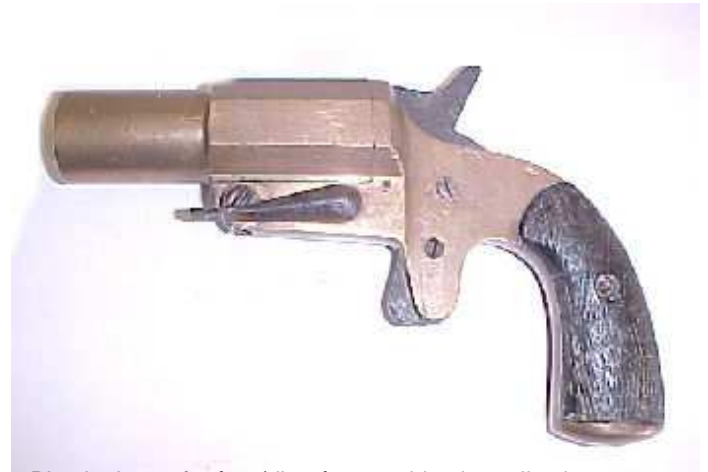
Pistolet lance-fusées

Ainsi les pistolets signaleurs se sont avérés très utiles.